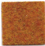
Cob orange 997