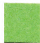
Acid green 7