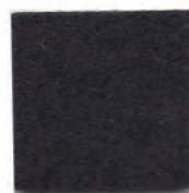
Rich black 18