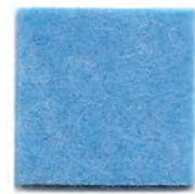
Light blue 8