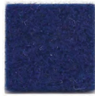
Deep sea blue 963