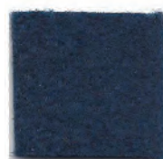
Dark blue 5