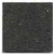
Dark musk 22