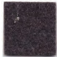
Dark brown 552