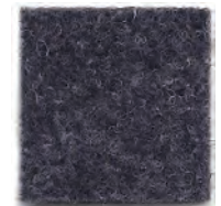
Dark grey 923