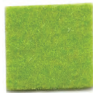
Acid green 611E