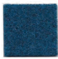
Peacock blue 962