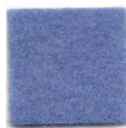
Light blue 914