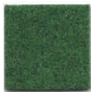
Leaf green 910