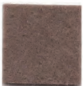
Tuscan brown 20