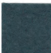
Grey green 22