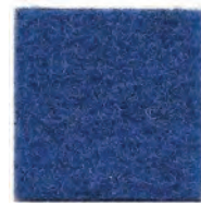
Honolulu blue 607