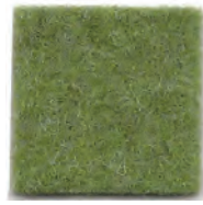
Cashmere green 89