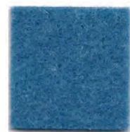
Sky blue 942