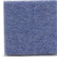
Blue yonder 200