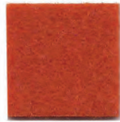
Dark orange 14