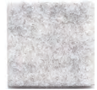
Ghost white 955