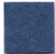
Summer night 21