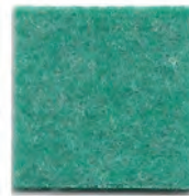
Water green 2