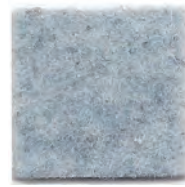
Fresh air 976